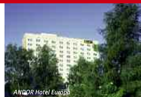
ANDOR Hotel Europa

** außer vom 17.05.12 bis 20.05.12 und 07.06.12 bis 10.06.12