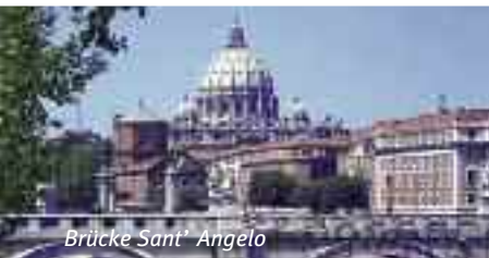
Brücke Sant' Angelo