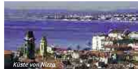
Küste von Nizza