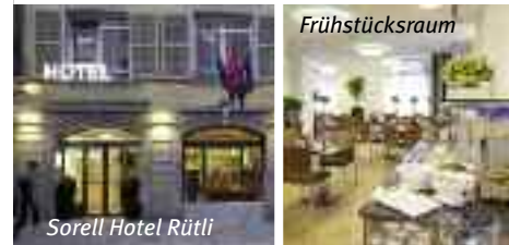
Sorell Hotel Rütli