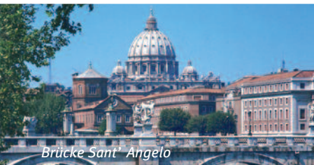
Brücke Sant' Angelo

Lebendige Geschichte und kosmopolitisches Treiben kennzeichnen Italiens Hauptstadt Rom. Versäumen Sie nicht einen Besuch im prunkvollen Vatikan!